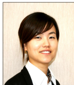
유니스 전 관장

얼마전 봉사회에서 18년동안 지속적으로 봉사를 하고 계시는 올해 팔순이신 봉사자와 여러 얘기를 나누다가 문득 “왜 봉사회에서 이렇게 오랫동안 봉사를 하고 계신가요?”라고 여쭙어 보았습니다. 그 분은 봉사회에서 밥을 먹으면 매일 잔치집에서 밥을 먹는 것 같으며 봉사회에 오면 참으로 평안과 안정을 갖게 된다고 하셨습니다. 하루 일과를 보낼 때 봉사회를 오지 않으면 뭔가가 허전하고, 봉사회를 왔다간 날은 하루가 기분이 좋고 기쁘다고 하셨습니다. 그 분은, 봉사회에 와서 표정이 어둡거나 어려운 일이 있어 보이는 회원분을 보면, 무슨 일이 있냐고 사연을 들어 주는 것이 자신의 사명이라며 봉사회가 마치 자기를 위해 존재하는 것 같다고 말씀하셨습니다.