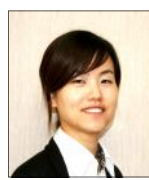
유니스 전 관장

우리가 흔히 관점의 차이를 설명할 때, 컵에 물이 반쯤 채워져 있는 잔을 예로 많이 듭니다. 어떤 사람은 그 컵을 보고 “컵에 물이 반밖에 없네.”라고 말하고, 또 다른 사람은 “컵에 물이 반이나 남아있네.”라고 말합니다. 하나의 사실에 대해 설명할 때, 그 사람이 가지고 있는 관점이나 느낌, 생각에 따라 180도 다른 내용으로 해석이 되는 것입니다. 제가 관점의 차이에 대해 말씀드리는 이유는 주변의 환경에 대해 어떤 분은 불평과 불만을 드러내는 반면, 어떤 분들은 같은 상황에도 주어진 환경에 감사하며 겸손한 자세로 늘 임하시는 분들이 있다는 얘기를 나누고 싶기 때문입니다. 봉사회에 오시는 분들 중 한 회원분은 “내가 어디가서 수강료 5월에 이렇게 좋은 프로그램을 즐겁게 참여할 수 있을까요?”라며 봉사회에 늘 빛을 지고 있는 느낌이라며 기쁘게 웃으십니다. 또 어떤 회원분은 “봉사회라면 이런 일 저런 일 다 무료로 해줘야 되는 거 아닌가요?”라며 개인의 심부름이나 사회복지와는 거리가 먼 일들을 도와달라며 요청하는 분들도 계십니다. 실리콘밸리 한미봉사회는 사회복지를 기반으로 두고 시니어들과 이민 가정, 저소득층, 청소년과 유아에 이르기까지 한인 사회의 전반적인 삶의 질의 향상을 위해 1979년에 설립되어 지금까지 그 정신과 일을 이어오고 있는 기관입니다. 메디칼을 포함한 각종 정부혜택 상담 및 신청, 전화 및 전기세 할인 프로그램, 정부아파트 관련 문제, 서류 번역, 시민권과 영주권 신청 및 갱신에 필요한 도움과 시니어 영양 프로그램, 시니어 웰빙 프로그램, 청소년 및 유아 프로그램, 연중 문화 행사 등 포괄적인 프로그램을 지속적으로 제공해 오고 있습니다. 회원 여러분! 적은 직원으로 어떻게 이렇게 많은 프로그램과 서비스를 제공해 오는지, 해마다 100명이 넘는 자원봉사자들과 봉사회를 위해 돕는 손길들에 감사하며 더 많은 봉사회의 발전을 빌어주시요. “컵에 물이 반이나 있구나.” 라는 마음가짐으로, 이 지역에 한미봉사회 같은 기관이 있어 감사하다고 격려해 주십시오. 여러분들의 격려로 저희는 더 힘을 얻고 지역 사회에 필요한 갈등을 해소해 드리도록 컵에 물을 가득 채우는 노력을 계속해서 해 나가겠습니다.