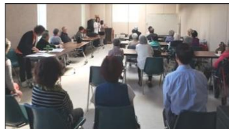
10월 : 대장암 예방 세미나