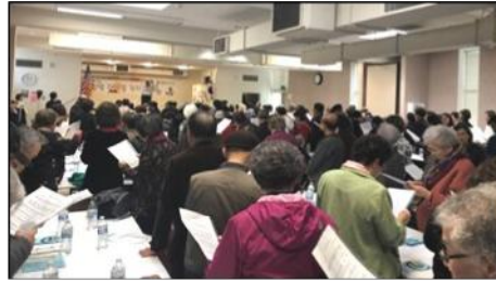
2월 : 정월대보름 잔치