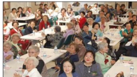
5월 : 어버이날