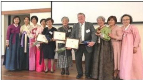
4월 : 40주년 기념행사