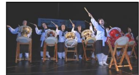
12월 : 예술제

지난 2019년 한해도 실리콘밸리 한미봉사회를 위해 후원해 주시고, 수고해주시고 도와주신 모든 분들께 진심으로 감사를 드립니다. 특별히 모든 자원봉사자분들께 머리숙여 감사의 마음을 전합니다.