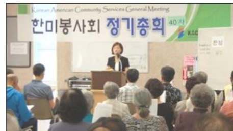
8월 : 정기총회