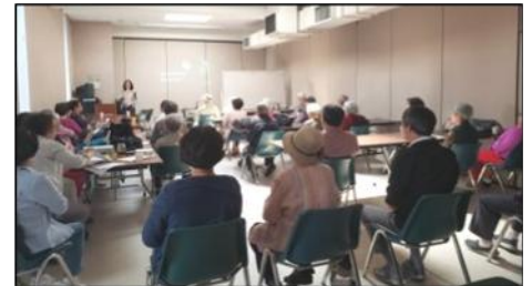
6월 : 건강보험 세미나