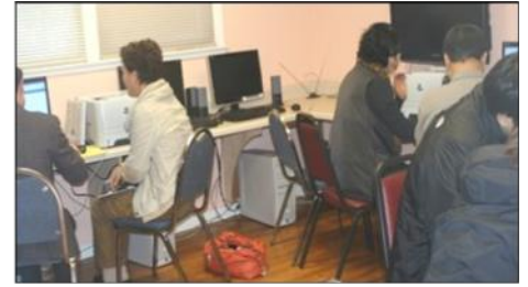
3월 : 무료 세금보고