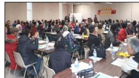
11월 : 추수감사절 잔치