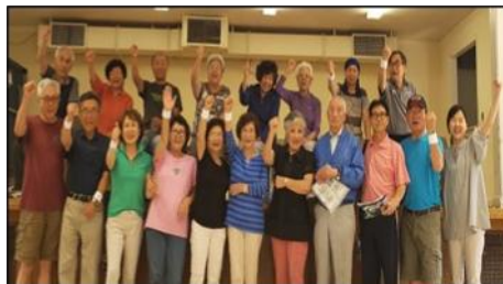
7월 : 탁구대회