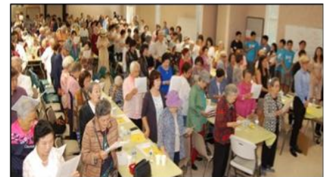
9월 : 한가위 잔치