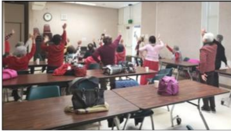
1월 : KACS CARE 프로그램