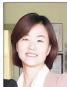
유니스 전 관장

회원여러분들, 그간 모두 건강하고 안전하게 지내시고 계시죠? 전세계를 힘들고 어렵게 하고 있는 질병이 이 곳 우리가 살고 있는 지역사회에서도 걱정과 두려움을 안기고 있습니다. 나이에 상관없이 모두에게 찾아올 수 있는 병이지만 특별히 고령 시니어들에게 치명적일 수 있다하여 캘리포니아 주를 포함하여 미국의 많은 지역에서 시니어분들은 자택에서 대기하며 건강을 조심하라는 명령까지 내려졌습니다. 지금까지 우리 모두 한번도 겪어보지 못한 이런 현실에서 회원분들과 특별히 고립되어 있을 시니어분들께 직접적인 도움의 손길을 드릴 수 없다는 사실이 저 또한 무기력하고 어렵게 만들고 있습니다.